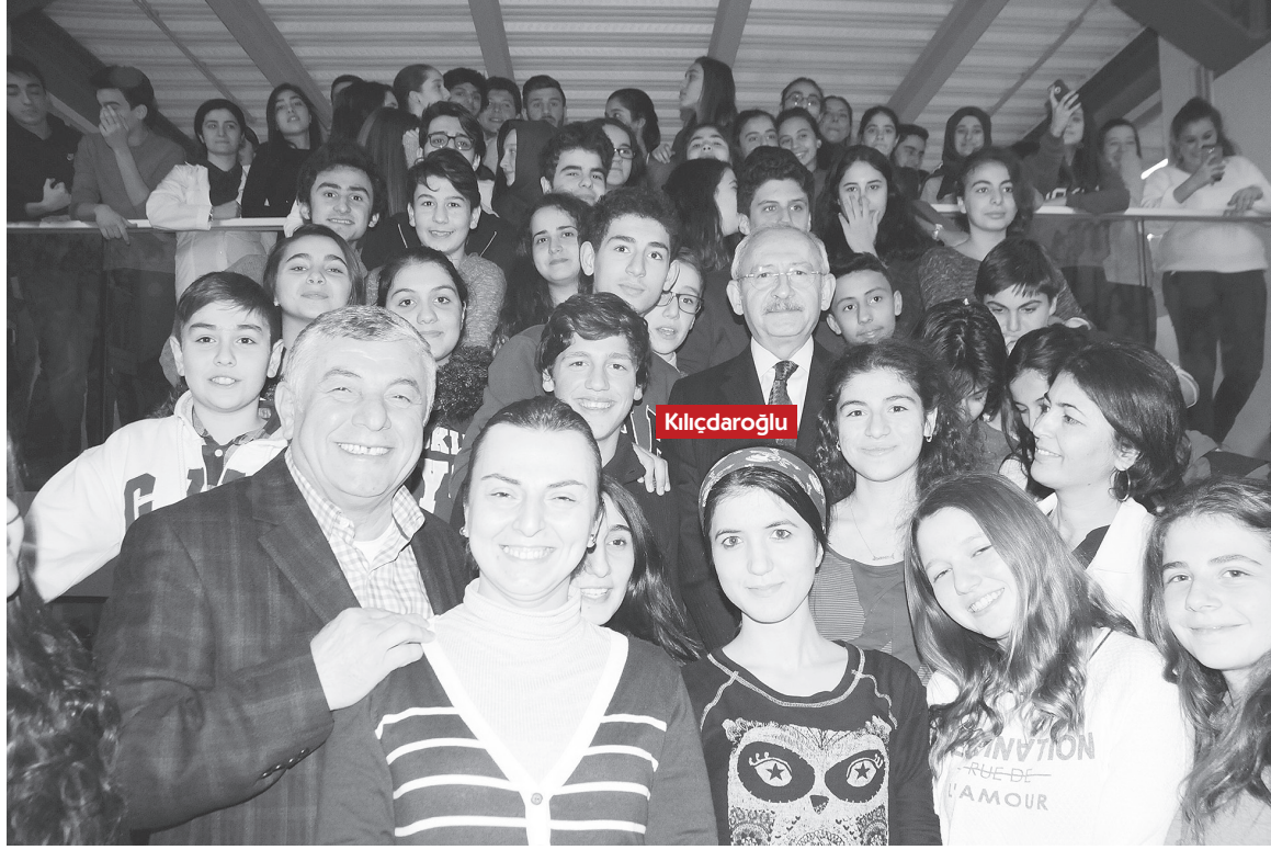
CHP Genel Başkanı Kılıçdaroğlu da Sarıyer Akademi'yi ziyaret ederek çalışmalar hakkında bilgi aldı.

Sarıyer Akademi'nin 150 eğitim kurumu arasında kısa sürede ilk 10'a girdiğini ve gün geçtikçe başarısının arttığını vurgulayan Şükrü Genç, “Bu kurumlar arasında Türkiye'nin en önemli fen liseleri de var, Robert Koleji de var. Öğrencilerimizin arkasında durup eğitim hayatında destek olmak bizim görevimiz” ifadelerini kullandı.